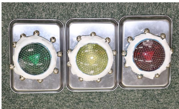
【音が鳴り，ライトが点灯する体鳴楽器】