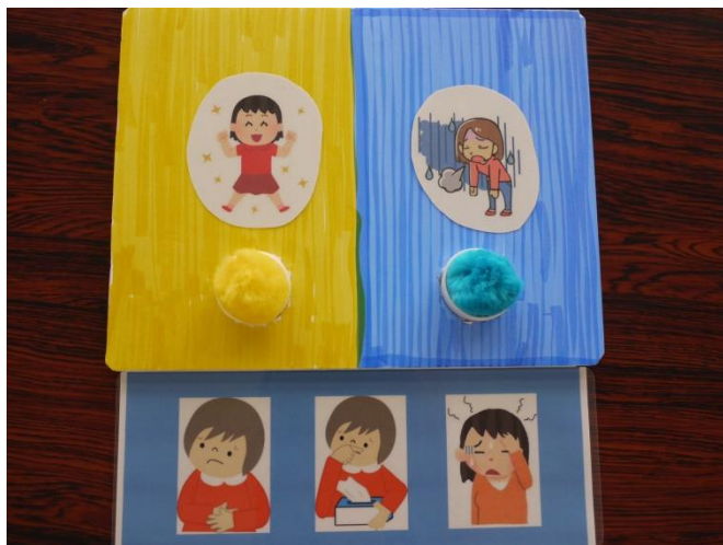
【健康状態を指さして伝える健康観察ボード】