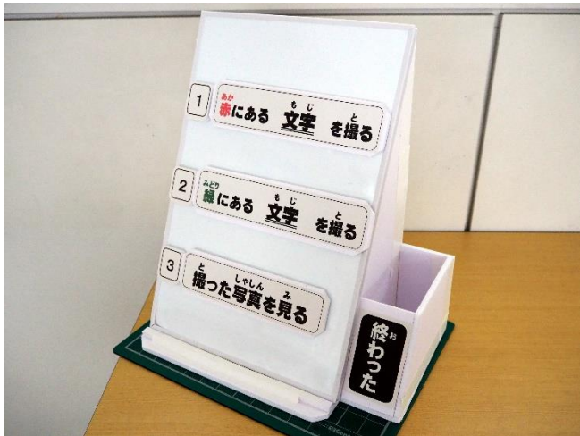
【活動が書かれたカードを取り外せる予定表】