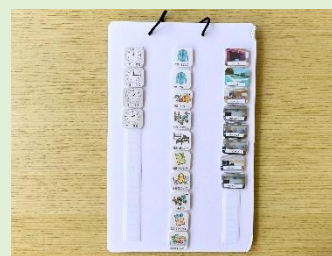
【裏面に種類別に並べたカード】

教科名や休憩時間にやることを示したイラストカードや、活動場所を示した写真カード、時計のカードを用意します。裏面に各カードを並べて分類しておくことで、生徒Aが、自分で教科と活動場所のカードを操作してスケジュールをつくり、1日の見通しをもつことができるようになりますと考えました。